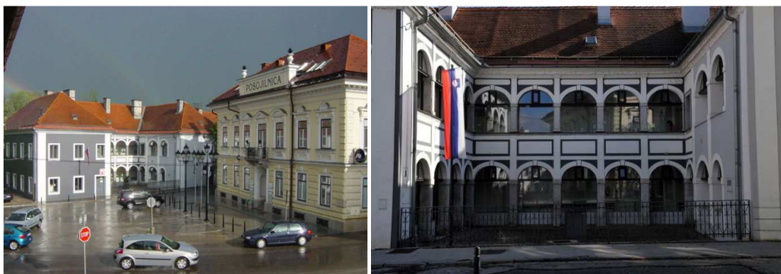
Slika 6, 7: Komenda