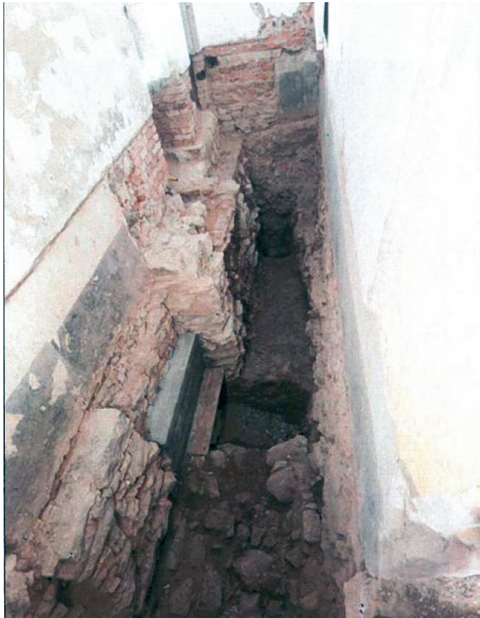
Slika 1.13, in 1.14: Srednjeveške in novoveške gradbene faze odkrite tekom arheoloških izkopavanj znotraj hiše na Ulici Mirana Jarca 3