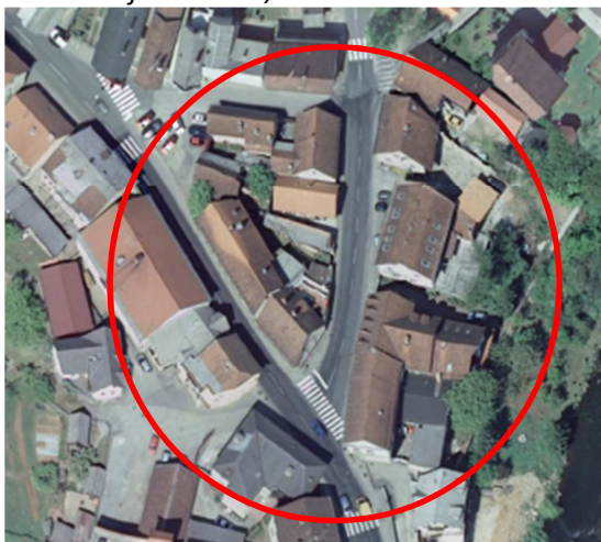
Slika 28: Izsek iz digitalnega orto foto posnetka