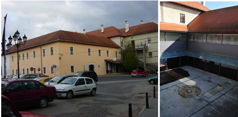
Slika 4, 5: Grad