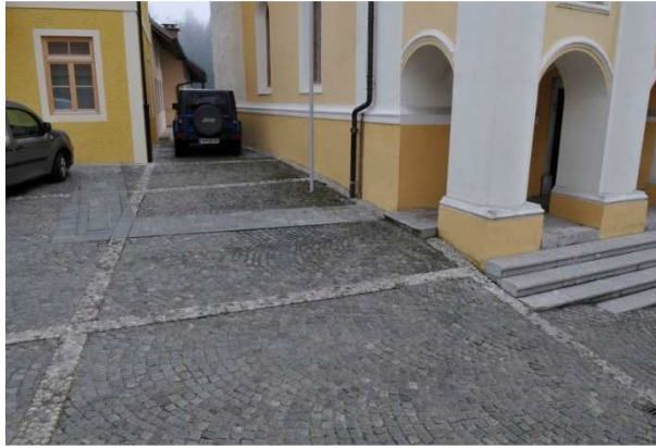
Slika 25: Parkiranje na prezentiranih površinah.