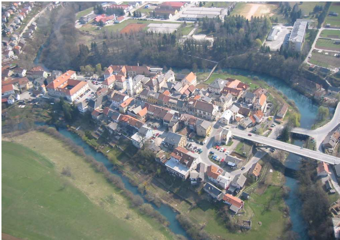
Slika 2: Lokacija mestno jedro Črnomelj

Ožje območje mestnega jedra je razglašeno za spomenik lokalnega pomena - naselbinski spomenik, določeno ima tudi vplivno območje. V vplivnih območjih spomenikov velja pravni režim varstva, ki določa, da morajo biti posegi in dejavnosti prilagojeni celostnemu ohranjanju spomenikov.