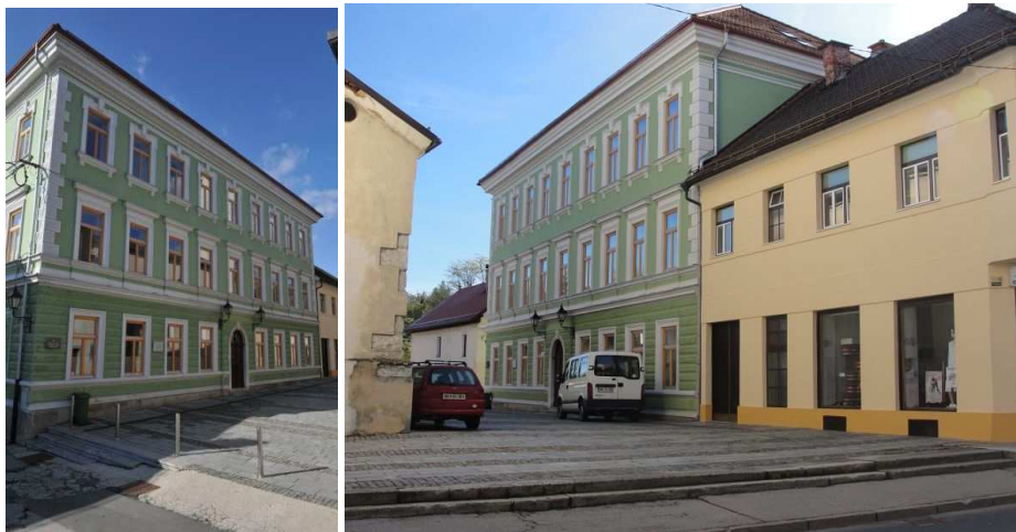
Slika15, 16: Stara šola