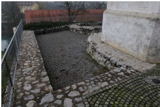
Slika 24: Pogled na prezentirano arhitekturo, ki jo na posameznih delih preraščajo mahovi, bršljan, trava.

Cerkev ni prezračevana, zato odstopajo ometi na spodnjih partijah sten v notranjosti in na zunanosti. Obiskovalcem je na voljo zloženka o zgodovini cerkve sv. Duha in mesta Črnomelj, medtem ko še kako potrebne označbe spomenika in pojasnjevalne table o prezentirani arheološki dediščini ni. Prezentirane arheološke strukture v različnem obsegu prekrivajo biološki dejavniki propadanja (mahovi, lišaji, trava, bršljan), ki bistveno vplivajo na mehanske poškodbe struktur.