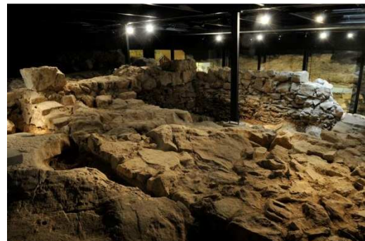
Slika 1.5: Levo: Notranjost Pastoralnega centra po izkopavanju v letu 1996 (Foto: F. Aš, Arhiv ZVKDS, CPA).