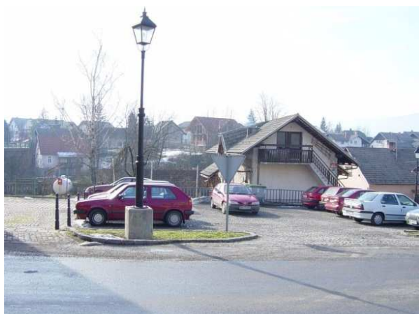
Slika 34: Lokacija bivšega Kobetičevega gradu