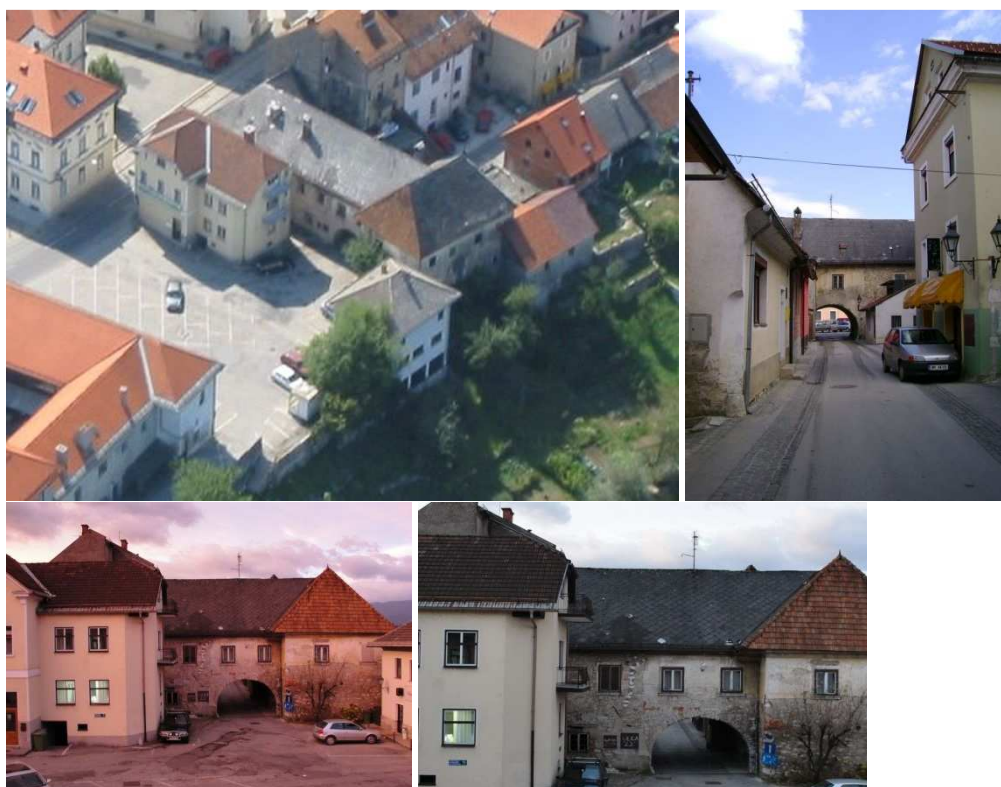
Slika 10, 11, 12, 13: Stoničev grad