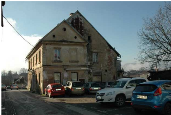
Slika 29: Hiša Na utrdbah 22