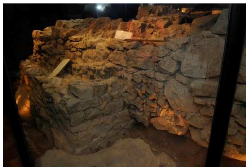
Slika 20 levo: Pogled na prezentirano arhitekturo s praznimi policami (Foto: F. Aš, Arhiv: ZVKDS, OE Novo mesto).

Na razstavnih policah manjkajo arheološki artefakti.