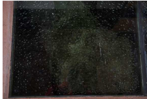
Slika 23: Pogled na od vlage zamegljene steklene plošče pod katerimi je prezentirana arheološka dediščina v cerkvi sv. Duha.

Cerkev ni prezračevana, zato odstopajo ometi na spodnjih partijah sten v notranjosti in na zunanosti. Obiskovalcem je na voljo zloženka o zgodovini cerkve sv. Duha in mesta Črnomelj, medtem ko še kako potrebne označbe spomenika in pojasnjevalne table o prezentirani arheološki dediščini ni. Prezentirane arheološke strukture v različnem obsegu prekrivajo biološki dejavniki propadanja (mahovi, lišaji, trava, bršljan), ki bistveno vplivajo na mehanske poškodbe struktur.