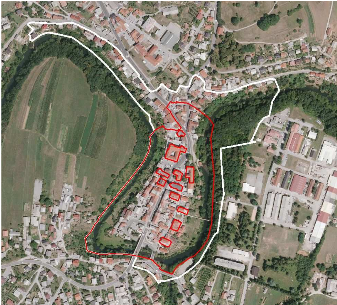
Slika 3: Lokacija mestno jedro Črnomelj z vplivnim območjem ter označenimi posameznimi spomeniki stavbne dediščine