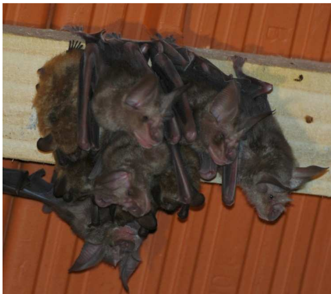
Slika 39: Mladi veliki podkovnjaki na podstrehi cerkve Svetega duha