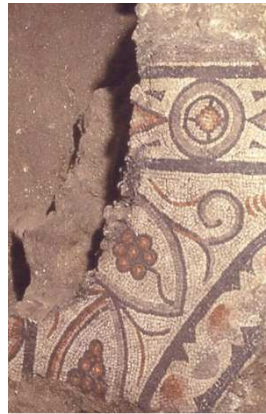
Slika 1.3 : Levo: Apsida zgodnjekršćanske cerkve in mlajšeželeznodobno tlakovanje znotraj cerkve sv. Duha po izkopavanju v letu 1991.