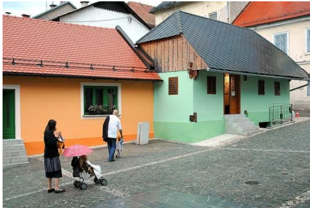
Slika 35: Maleričeva hiša