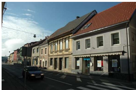
Slika 37: Zahodni stavbni niz Ulice Staneta Rozmana