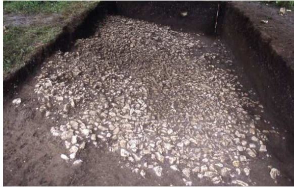
Slika 1.10 in 1.11: Levo: Izkopane poznobronastodobne in starejšeželeznodobne odpadne oz. shrambene jame ter poznoantično grobišče na levem bregu Lahinje (Foto: P. Mason, Arhiv ZVKDS, CPA). Desno: Poznorimskodobno tlakovanje na bregu Lahinje med izkopavanjem v letu 1996 (Foto: P. Mason, Arhiv ZVKDS, CPA).