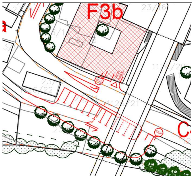
Slika 3.1: Lokacija parkirišč ob Ulici na utrdah in Ulici Staneta Rozmana (Vir:OLN)

Z OLN so predvidene lokacije za nova območja parkiranja. Parkirišča, ki so izvedljiva z manjšimi investicijskimi stroški, so predvidena ob cesti pod velikim mostom (12 parkirnih mest – slika 3.1), 7 parkirnih mest ob Ulici na utrdah – (slika 3.2) in 20 parkirnih mest ob Ulici Staneta Rozmana – (slika 3.1). Zadnje bo mogoče urediti šele po dokončanju celotne trase mestne obvoznice. Zadostno število parkirnih mest je predvideno z večjimi posegi, posledično pa so za izvedbo potrebna tudi večja finančna sredstva in presoja o smotrnosti gradnje, saj gre za podzemna parkirišča. V tem primeru je z OLN dovoljena gradnja 78 podzemnih parkirišč na lokaciji bivšega Kobetičevega gradu (slika 3.3). Smotrnost gradnje se lahko upraviči v sklopu gradnje nadomestnega objekta na tej lokaciji.