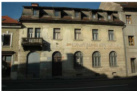
Slika 26: Sinkovičeva hiša