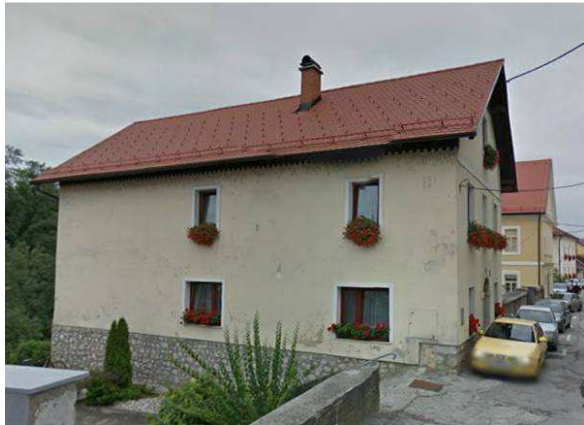
Slika 30: Hiša Ulica Mirana Jarca 1