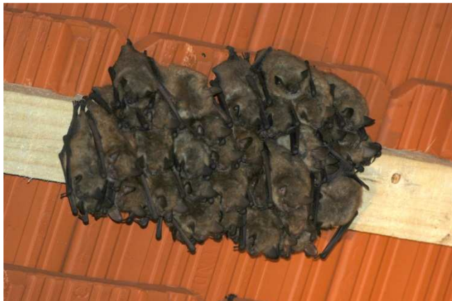
Slika 37: Vejicati netopirji na podstrehi cerkve Svetega duha