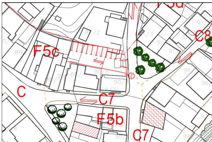
Slika 3.4: Parkirišče – Ulica pod lipo

Možnosti enostavnejše rešitve problematike parkiranja tako za obiskovalce, zaposlene in prebivalce mestnega jedra se lahko iščejo na sosednjem območju Majer, ki je enostavno in peš dostopno preko mosta za pešce. Pomanjkljivost te lokacije je le v neprimernem dostopu do mestnega jedra za invalide.