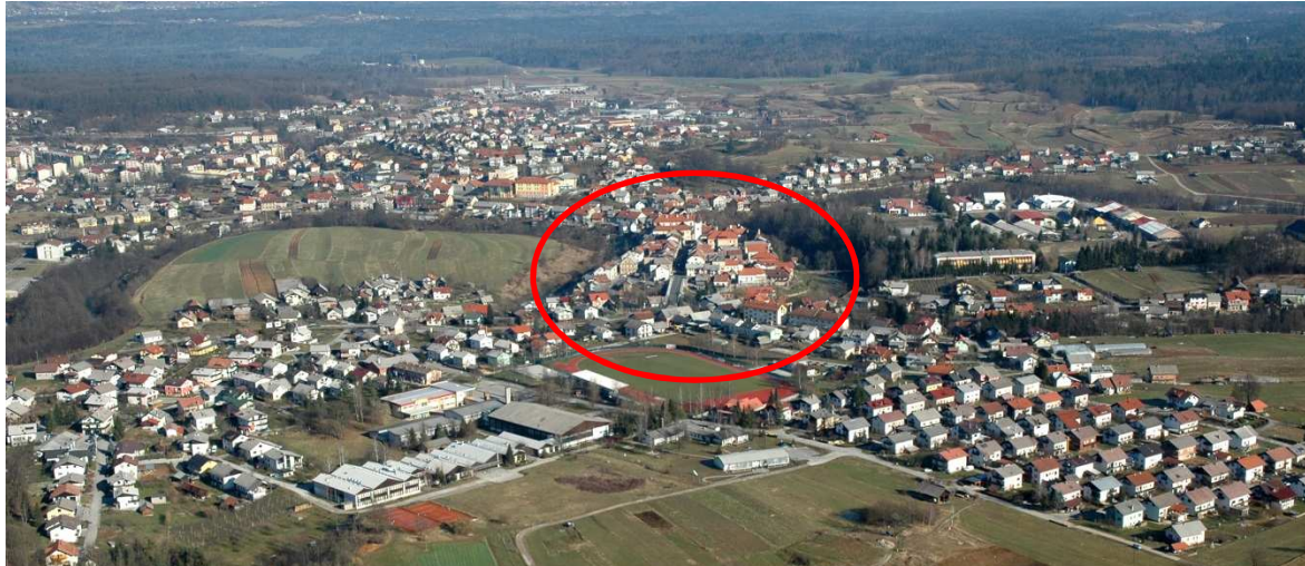
Slika 1: Črnomelj iz zraka

Mestno jedro Črnomelj leži na okljuku rek Dobljčice in Lahinje, preko katerega vodijo poti iz Metlike in Semiča proti Adlešičem, Staremu trgu ob Kolpi in Vinici. Nadmorska višina območja je povprečno 154 m nadmorske višine, teren je kraški, podnebje pa je zmerno celinsko. V mestu Črnomelj živo okrog 5000 prebivalcev, na območju mestnega jedra je registriranih 270 prebivalcev.