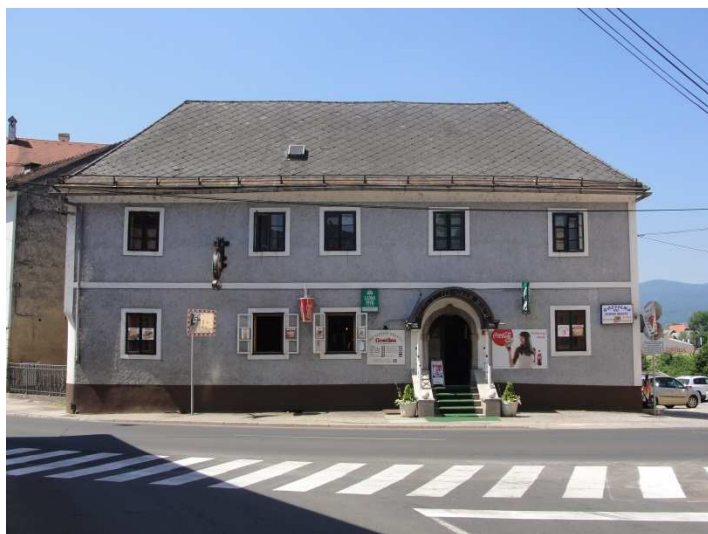
Slika 27: Haringova hiša