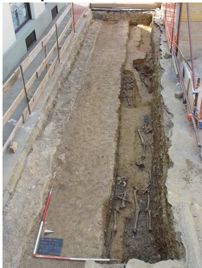
Slika 1.12: Del srednjeveškega in novoveškega pokopališča ob cerkvi sv. Petra (Foto: T. Britovšek, Arhiv ZVKDS, CPA).

Arheološka izkopavanja na platoju med Staro šolo in cerkvijo sv. Petra so bila izvedena poleti leta 2008. Skupna površina raziskanih površin je bila 115 m 2 . Odkritih je bilo preko 300 ostankov grobov iz srednjega in novega veka, ki so bili zaradi novodobnih posegov in naknadnih pokopov slabo ohranjeni in poškodovani. Pokopališče okrog cerkve sv. Petra je bilo leta 1802 opuščeno in prestavljeno v Vojno vas. Pod grobiščem se kažejo ostanki struktur, ki pripadajo poznoantičnemu in mlajšeželeznemu obdobju.