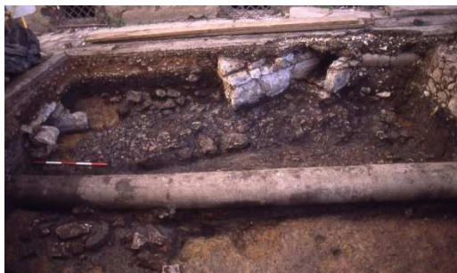
Slika 1.8: Ostanke mlajšeželeznodobnega tlakovanja.

Arheološka sondiranja na vzhodnem delu Ulice Mirana Jarca so bila izvedena leta 1998 zaradi predvidenega izkopa za plinovod. Raziskanih je bilo 24 m 2 površine. Odkrit je bil jugovzhodni vogal srednjeveškega in novoveškega pokopališča ob cerkvi sv. Petra. Znotraj pokopališča je bilo odkritih 11 grobov, vsi so ležali v smeri vzhod – zahod, brez grobnih pridakov. Najmlajšo poznoantično plast je predstavljala zbita površina – hodna površina, ki je na podlagi najdb uvožene keramike datirana v prvo polovico 6. stol. n. št. Naslednja faza je datirana v 5. stol. n. št., gre za leseno strukturo, ki jo lahko povežemo s podobnimi objekti odkritimi na območju Pastoralnega centra in na Ulici na Utrdbah. Na podlagi odkritih, med seboj zelo podobnih struktur, na različnih lokacijah znotraj mestnega jedra v Črnomlju lahko sklepamo, da je poselitvena slika v 5. stol. n. št. predstavljala niz lesenih stavb, vzdolž tlakovane komunikacije znotraj poznoantičnega obzidja. V prvi polovici 6. stol. n. št. se prostorska ureditev naselja spremeni. Z gradnjo kamnitih stavb tik ob obzidju je bila stara komunikacija onemogočena, zato je bilo potrebno zagotoviti novo komunikacijo znotraj obzidja. Zato je bil niz lesenih stavb porušen in zravnán z zbitim nasutjem, ki predstavlja komunikacijo v 6. stol. n. št. Poznoantične plasti so ležale nad plastjo erozijskega izvora, ki je prekrila dve fazi mlajšeželeznodobne naselbine (Mason 2001a, 19 - 20).