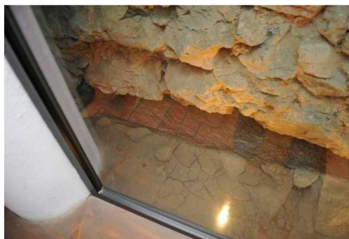
Slika 21 desno: Odpadajoče kamenje iz prezentiranega zidu.