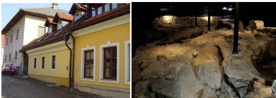
Slika 19: Pastoralni center