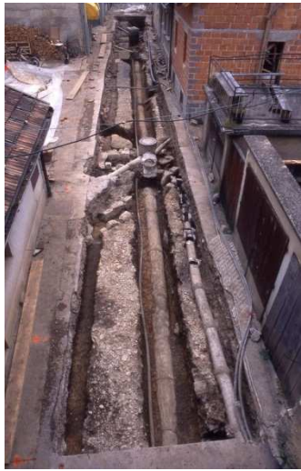
Slika 1.7: Ostanke srednjeveške ceste in recentna infrastruktura na območju Ulice Na utrdbah med izkopavanjem v letu 2001 (Foto: P. Mason, Arhiv ZVKDS, CPA).

sledove dveh faz mlajšeželeznodobnega naselja. Prvo fazo predstavlja kompleks jam za stojke, ki tvorijo strukturo pravokotnega tlora in pa drenažni jarki. Drugo fazo predstavlja tlakovanje z apnenčastimi oblicami, kosi žlindre in obdelanimi kamni – žrmlje in brusi (Mason 2001a, 19).