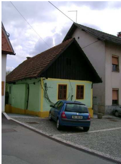
Slika 31: Hiša Ulica Mirana Jarca 11