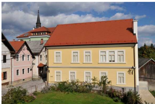
Slika 17: Hiša Mirana Jarca 3