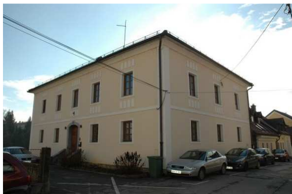
Slika 18: Župnišče