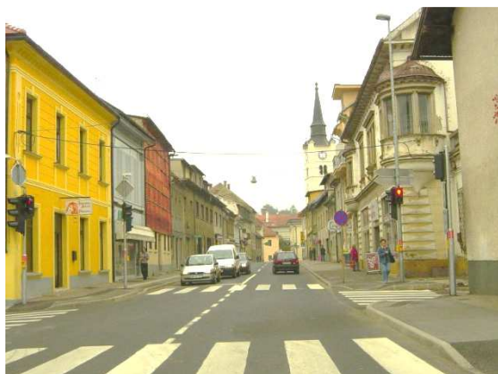
Slika 36: Vzhodni stavbni niz Ulica Staneta Rozmana na desni strani