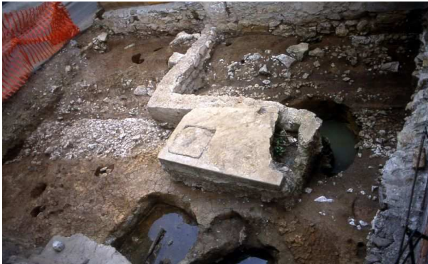
Slika 1.9: Kamnita tlakovana pot z drenažnima jarkoma in jame iz mlajše železne dobe na območju Maleričeve hiše med izkopavanjem v letu 2001.

Raziskave so potrdile obstoj mlajšeželeznodobnega naselja na tem prostoru. Temu obdobju lahko pripišemo tlakovano površino, kot nekakšna pot, ki je ležala v plitvem žlebu in je potekala v smeri sever – jug. Ob vzhodnem robu žleba sta potekala vzporedna drenažna jarka (Mason 2008, 52). Mlajšeželeznodobno naselje je prekrila plast erozijskega izvora, na katero je bilo postavljeno poznoantično naselje. Iz tega časa so bili odkriti ostanki dveh zidov, kurišče in zunanja hodna površina (Mason 2006, 35).