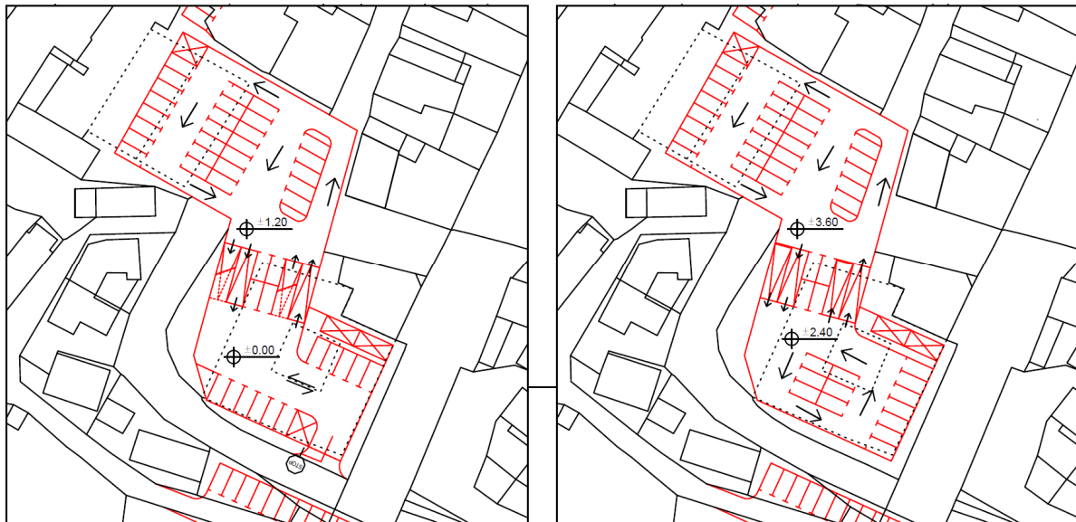
Slika 3.: Podzemno parkirišče v dveh nivojih – lokacija bivšega Kobetičevega gradu. Levo: spodnji nivo, desno: zgornji nivo)