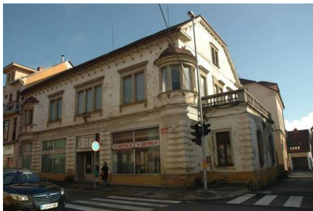
Slika 33: Hiša Ulica Staneta Rozmana 15