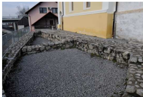
Slika 1.1 in 1.2: Levo: Poznorimskodobni vogalni stolp in obzidje na območju južne terase ob cerkvi sv. Duha po izkopavanju v letu 1990. Desno: In situ prezentacija arheoloških struktur.