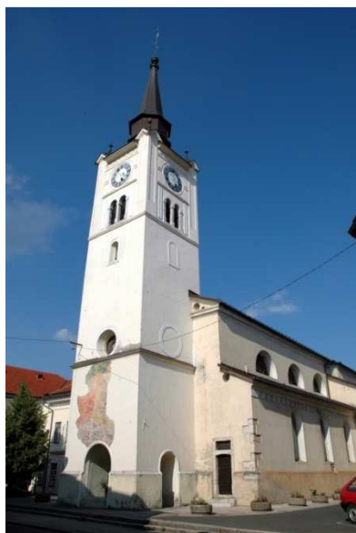
Slika 14: Cerkev sv. Petra