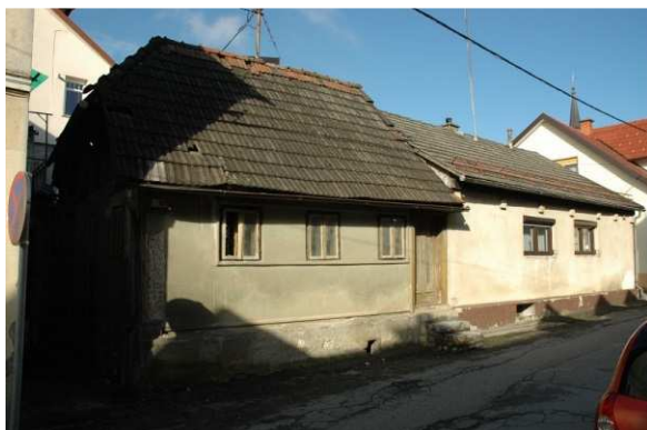
Slika 32: Ulica Mirana Jarca 14 in 16