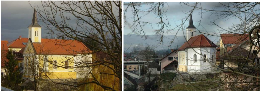
Slika 22: Cerkev Sv. Duha