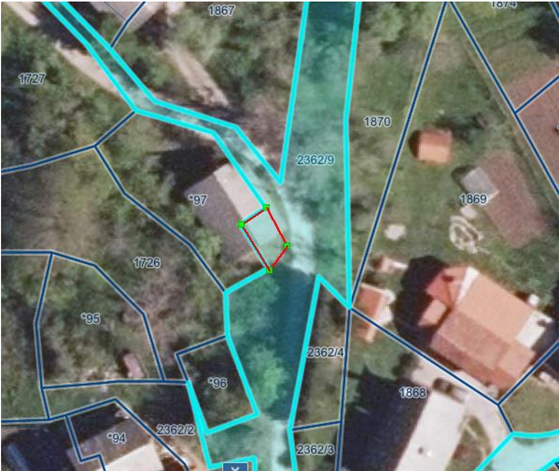
Priloga: grafični prikaz zemljišča