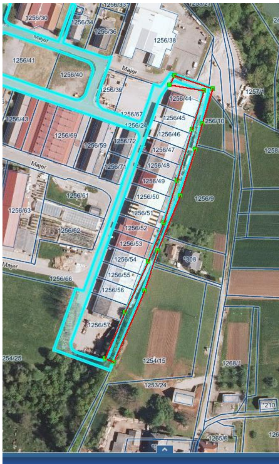
Priloga: grafični prikaz zemljišča